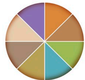
de 8 levensgebieden

Als Ordevos coach werk je integraal: je kunt coachen op alle levensgebieden en in hun onderlinge samenhang.