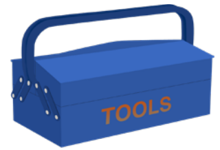
de ordevos toolkit